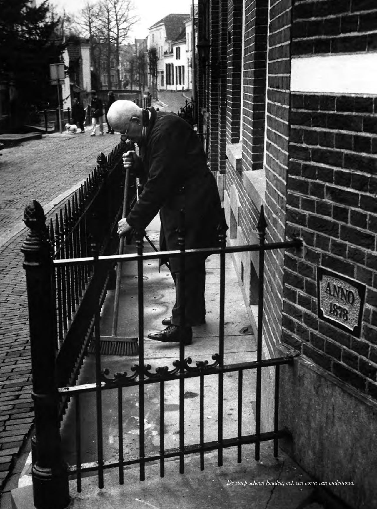
De stoep schoon houden; ook een vorm van onderhoud.