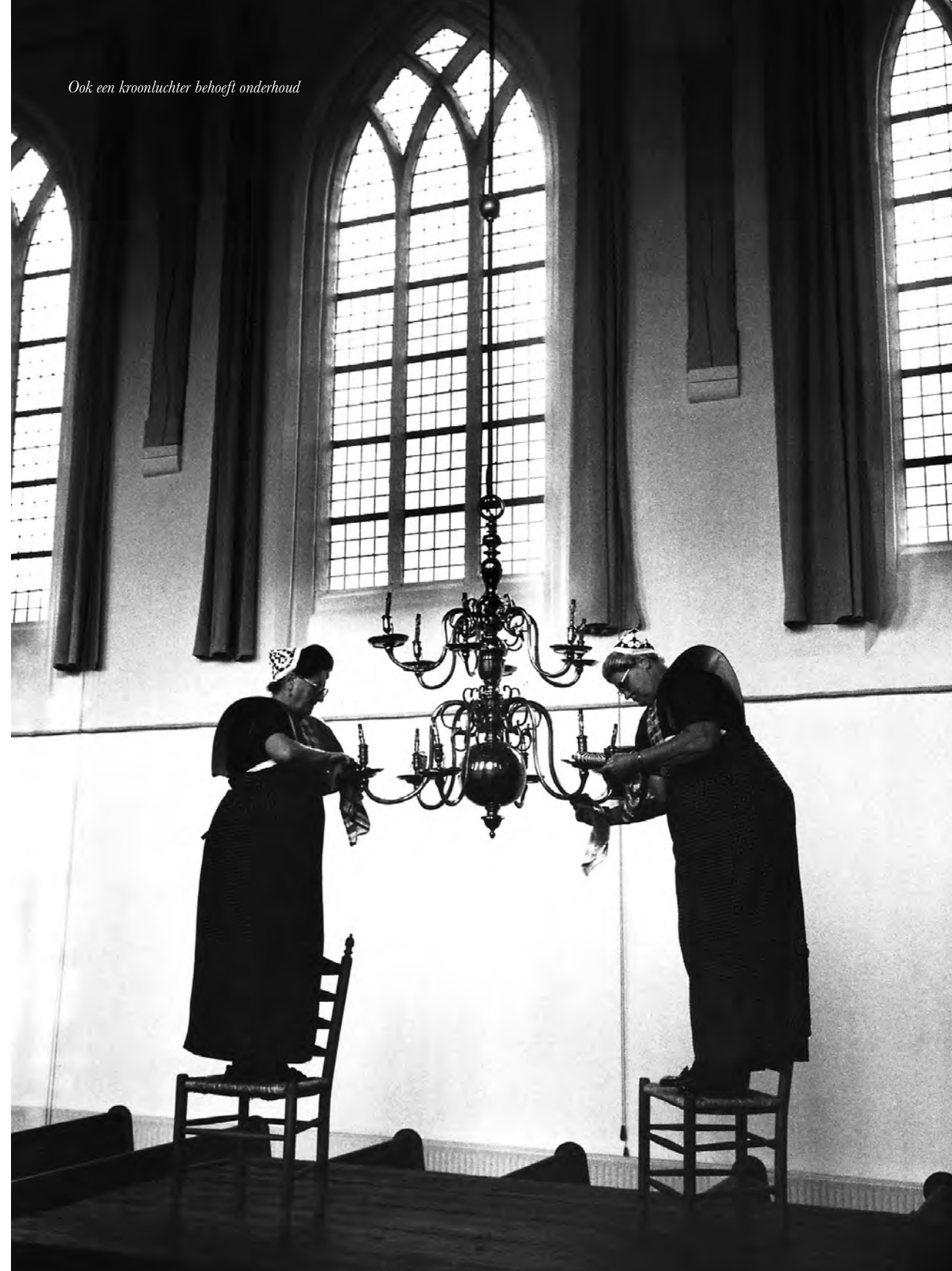
Ook een kroonluchter behoeft onderhoud